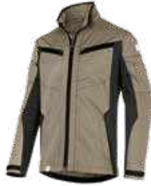
1230 5370-2599 KÜBLER INNOVATIQ JACKE XS-4XL