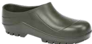
Oliv 8180 9934-66 36-47

Schale und Sohle aus Polyurethan | Herausnehmbares PU-Fußbett mit Microfaser-Decksohle | Auswaschbar | Rutschhemmende Laufsohle | Anatomische Passform garantiert leichtes An- und Ausziehen durch breite Form und zusätzlichen Platz im Fersenbereich | Auftritts-dämpfende Ferse | Selbstreinigende Laufsohle | Leicht zu reinigendes Obermaterial | Sehr gute Beständigkeit gegen tierische Fette, Gülle, Blut, organische Säuren, Basen, Hydrokarbonat und Alkohol | REACH-konform und phthalatfrei