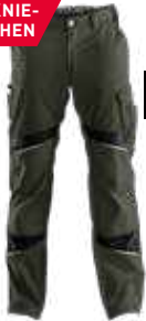
2350 5365-6699 KÜBLER ACTIVIQ HOSE HIGH 40-66, 90-118, 25-31