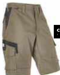
2430 5370-2599 KÜBLER INNOVATIQ SHORTS 40-66