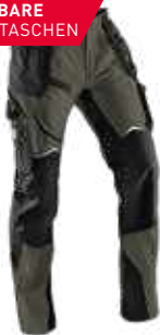
2351 9314-6699 KÜBLER PRACTIQ HOSE 40-66, 90-118, 25-31