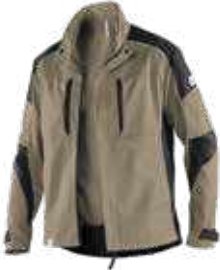
1250 5365-2599 KÜBLER ACTIVIQ JACKE XS-4XL