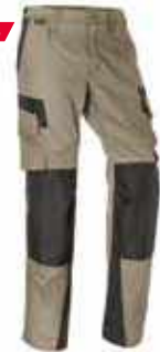
2530 5370-2599 KÜBLER INNOVATIQ DAMENHOSE D34-D54