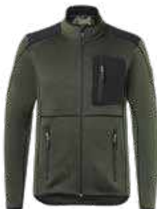
1443 6339-6699 KÜBLER WEATHER STRICKJACKE XS-4XL