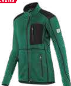
1444 6339-6599 KÜBLER WEATHER STRICKJACKE DAMEN XS-2XL