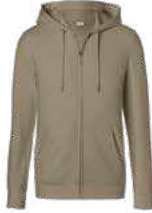
5022 6330-25 KAPUZEN-SWEATJACKE XS-4XL