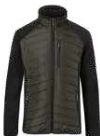
1342 5201-6698 KÜBLER WEATHER HYBRIDJACKE XS-4XL