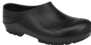
Schwarz 8180 9934-99 36-47