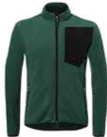
1254 6201-6599 KÜBLER WEATHER FLEECEJACKE XS-4XL