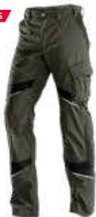
2550 5365-6699 KÜBLER ACTIVIQ DAMENHOSE D34-D54