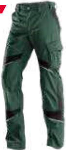
2550 5365-6599 KÜBLER ACTIVIQ DAMENHOSE D34-D54