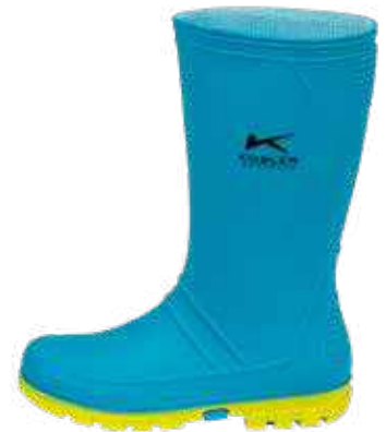
Türkis 8176 9930-44 27-35

Langschaftstiefel | Anatomisch geformtes Fußbett | REACH-konform und phthalatfrei