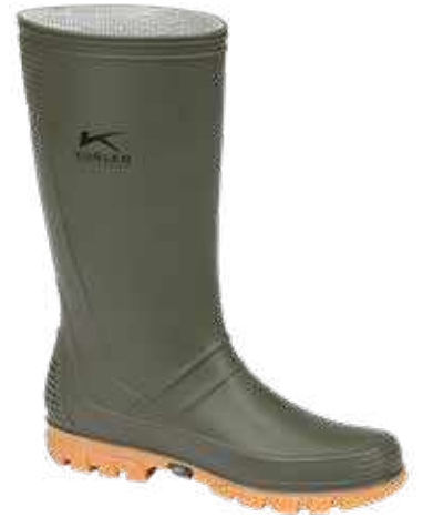
Oliv 8177 9931-66 36-42