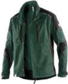
1250 5365-6599 KÜBLER ACTIVIQ JACKE XS-4XL