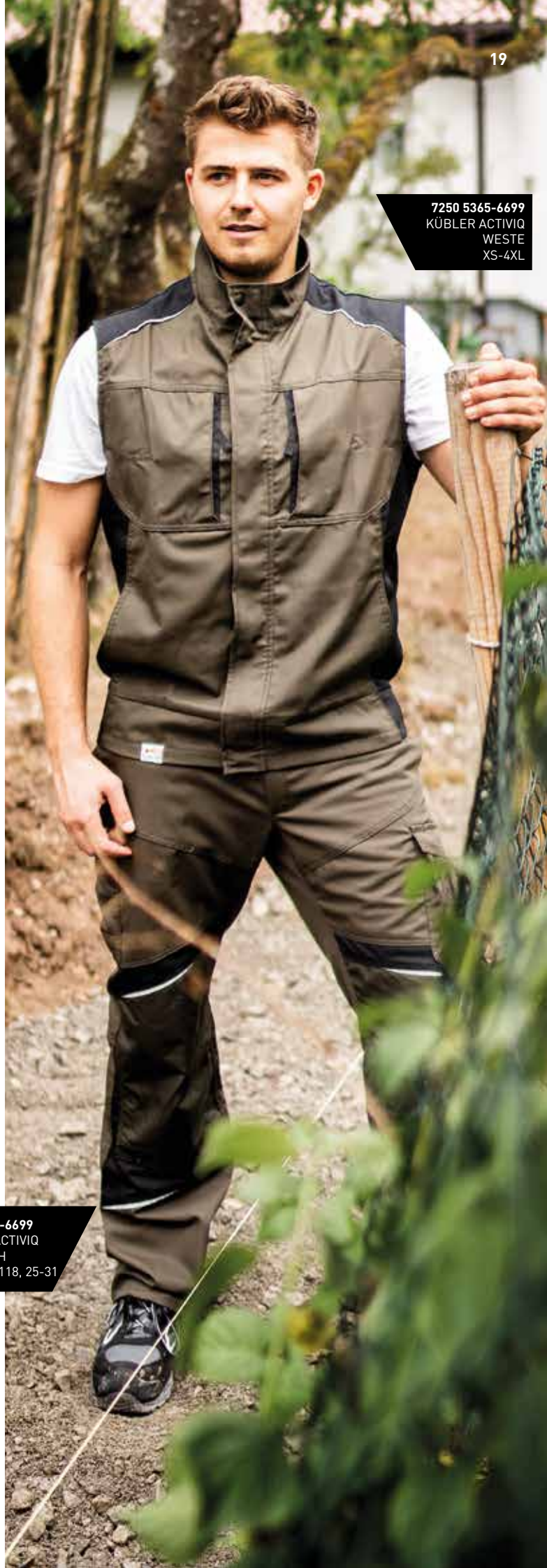
7250 5365-6699 KÜBLER ACTIVIQ WESTE XS-4XL