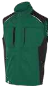
7250 5365-6599 KÜBLER ACTIVIQ WESTE XS-4XL