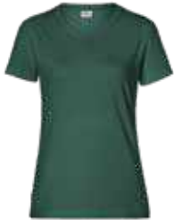
5024 6238-65 T-SHIRT DAMEN XS-4XL