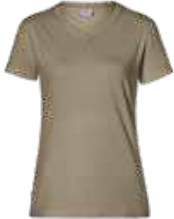
5024 6238-25 T-SHIRT DAMEN XS-4XL