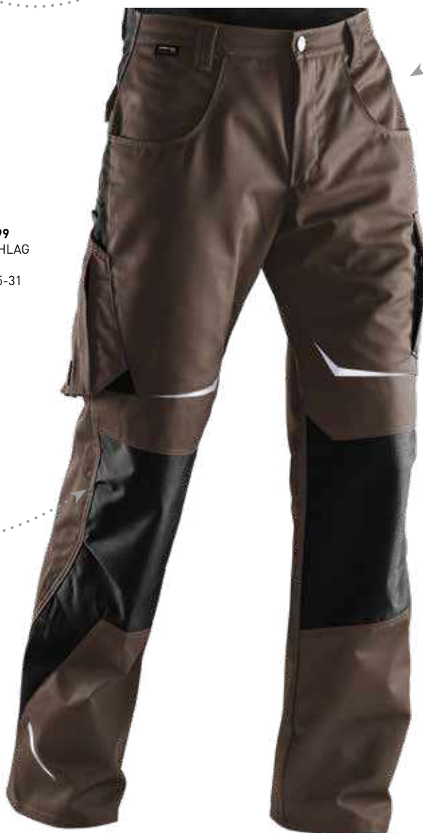
2324 5346-2899 KÜBLER PULSSCHLAG HOSE HIGH 40-66, 90-118, 25-31