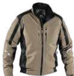
1367 5229-2599 KÜBLER WEATHER WETTERBLOUSON XS-4XL