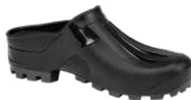
Schwarz 8178 9932-99 36-47