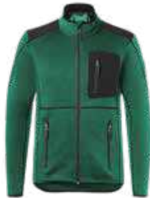
1443 6339-6599 KÜBLER WEATHER STRICKJACKE XS-4XL