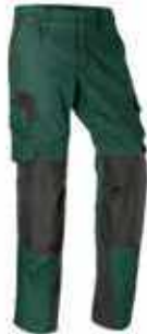
2230 5370-6599 KÜBLER INNOVATIO HOSE 40-66, 90-118, 25-31