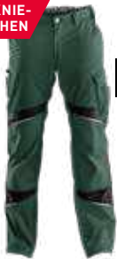
2350 5365-6599 KÜBLER ACTIVIQ HOSE HIGH 40-66, 90-118, 25-31