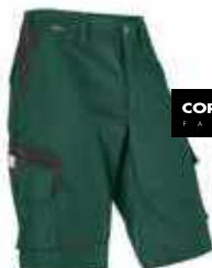
2430 5370-6599 KÜBLER INNOVATIO SHORTS 40-66