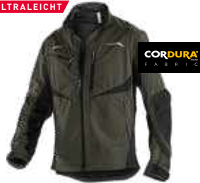
1351 5227-6699 KÜBLER PRACTIQ ULTRASHELL JACKE XS-4XL