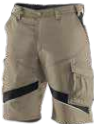
2450 5365-2599 KÜBLER ACTIVIQ SHORTS 40-66