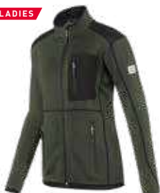
1444 6339-6699 KÜBLER WEATHER STRICKJACKE DAMEN XS-2XL