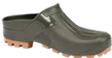
Oliv 8178 9932-66 36-47

Schale und Sohle aus PVC | Herausnehmbares PE-Fußbett | Auswaschbar | Rutschhemmende Laufsohle | Anatomische Passform garantiert leichtes An- und Ausziehen durch breite Form und zusätzlichen Platz im Fersenbereich | Selbstreinigende Laufsohle | Leicht zu reinigendes Obermaterial | Sehr gute Beständigkeit gegen tierische Fette, Gülle, Blut, organische Säuren, Basen, Hydrokarbonat und Alkohol | REACH-konform und phthalatfrei