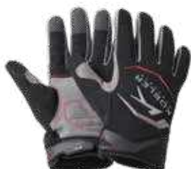
8001 9414-9995 KÜBLER ZUBEHÖR HANDSCHUHE S-3XL