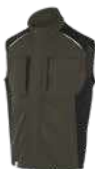
7250 5365-6699 KÜBLER ACTIVIQ WESTE XS-4XL