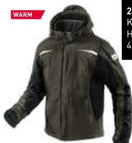
1041 7322-6699 KÜBLER WEATHER WINTER SOFTSHELL JACKE XS-4XL