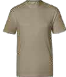
5124 6238-25 T-SHIRT XS-6XL