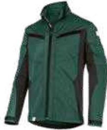
1230 5370-6599 KÜBLER INNOVATIO JACKE XS-4XL