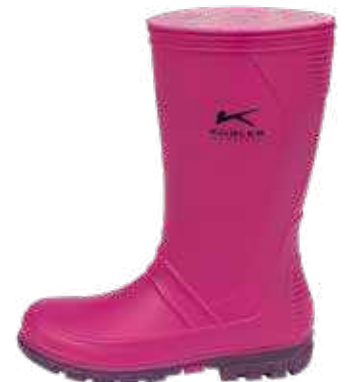
Pink 8176 9930-52 27-35