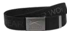
8303 9217-99 STRETCHGÜRTEL MIT FLASCHENÖFFNER ONE SIZE