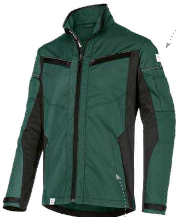
1230 5370-6599 KÜBLER INNOVATIO JACKE XS-4XL