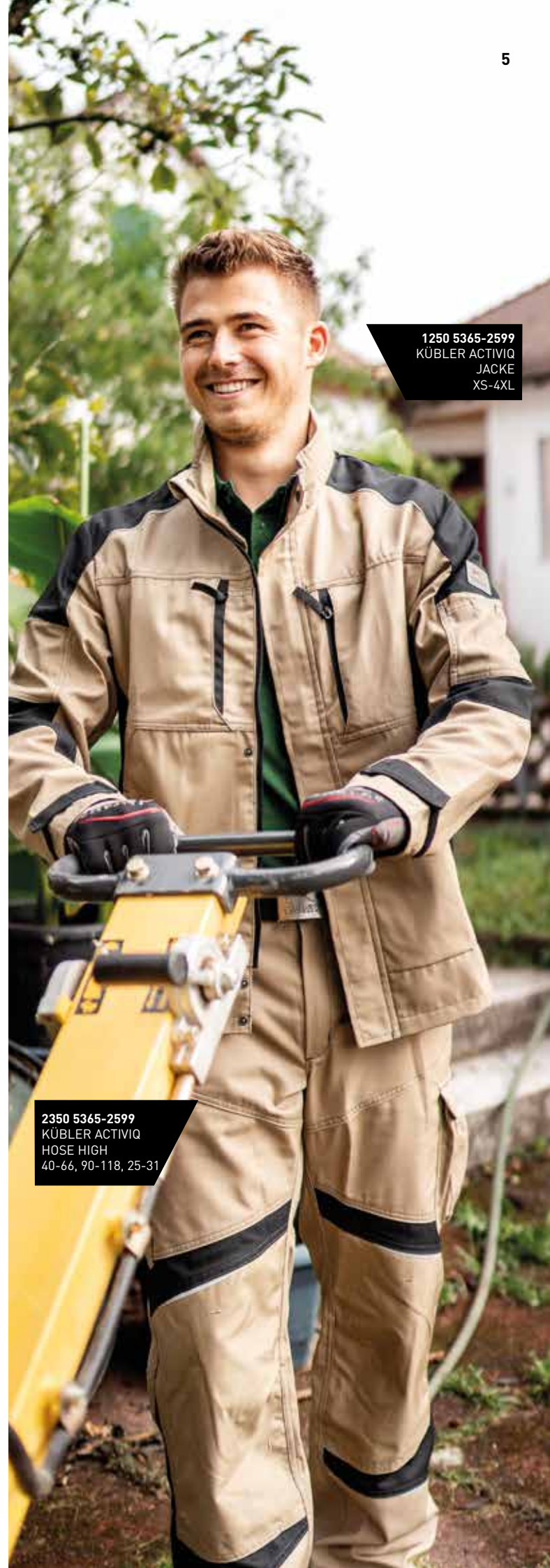
1250 5365-2599 KÜBLER ACTIVIQ JACKE XS-4XL