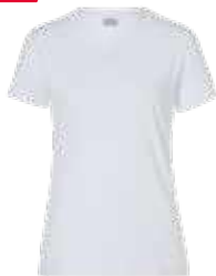
5024 6200-10 T-SHIRT DAMEN XS-4XL