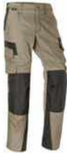
2230 5370-2599 KÜBLER INNOVATIQ HOSE 40-66, 90-118, 25-31