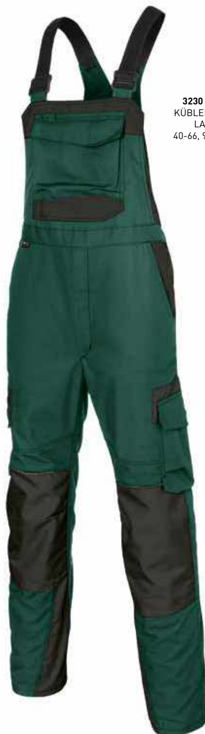
3230 5370-6599 KÜBLER INNOVATIO LATZHOSE 40-66, 90-118, 25-31