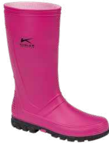
Pink 8177 9931-52 36-42