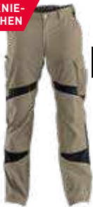
2350 5365-2599 KÜBLER ACTIVIQ HOSE HIGH 40-66, 90-118, 25-31