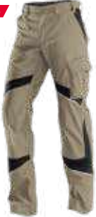
2550 5365-2599 KÜBLER ACTIVIQ DAMENHOSE D34-D54