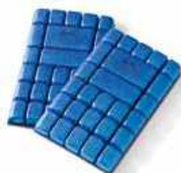
8108 9119-45 KNIEPOLSTER ONE SIZE