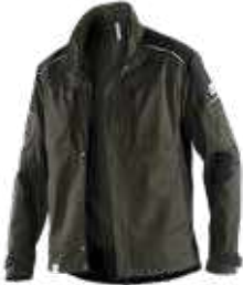
1250 5365-6699 KÜBLER ACTIVIQ JACKE XS-4XL