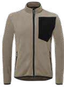
1254 6201-2599 KÜBLER WEATHER FLEECEJACKE XS-4XL