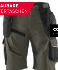
2451 9314-6699 KÜBLER PRACTIQ SHORTS 40-66