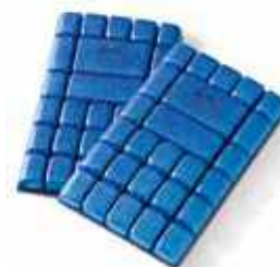
8108 9119-45 KNIEPOLSTER ONE SIZE