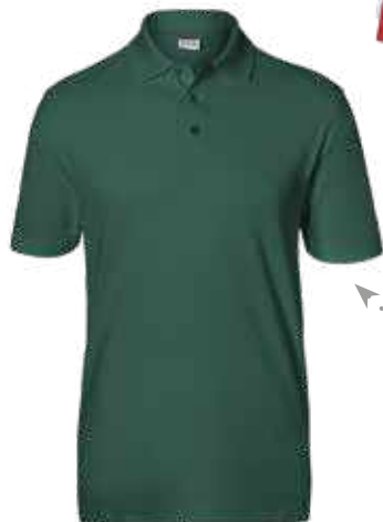
5126 6239-65 POLO XS-6XL