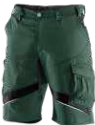
2450 5365-6599 KÜBLER ACTIVIQ SHORTS 40-66