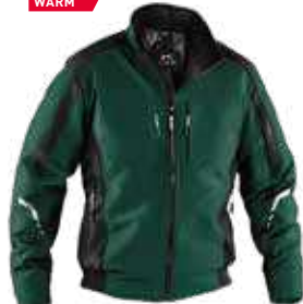
1367 5229-6599 KÜBLER WEATHER WETTERBLOUSON XS-4XL

1230 5370-6599 KÜBLER INNOVATIOQ JACKE XS-4XL