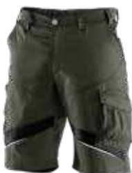
2450 5365-6699 KÜBLER ACTIVIQ SHORTS 40-66