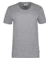
015 grau meliert