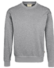
015 grau meliert