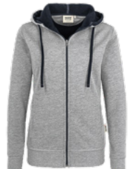
015 grau meliert/tinte