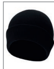
KXASHS Schwarz 19 x 20 cm