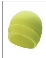
KXASHG Gelb 19 x 20 cm

Sport, Events, Industrie , Security, Radfahren, Joggen, Wandern, Schulweg