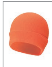
KXASHO Orange 19 x 20 cm