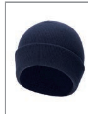
KXASHN Navy 19 x 20 cm