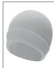
KXASHW Weiß 19 x 20 cm