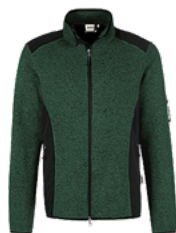
372 tanne meliert