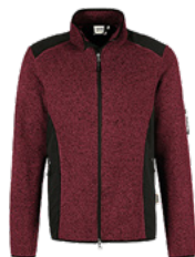
317 weinrot meliert

Ursprungsland Kambodscha Zolltarifnummer 6110 3091 Datenblatt Stand: 11/2023