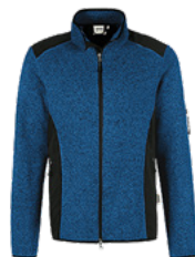
310 royalblau meliert