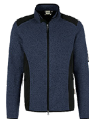
329 marine meliert