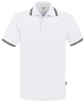
001 weiß / schwarz

Ursprungsland Türkei Zolltarifnummer 6105 1000 Datenblatt Stand: 11/2023