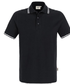
005 schwarz / weiß