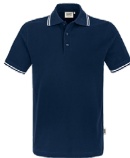
034 tinte / weiß