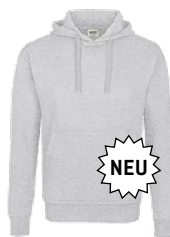
024 ash meliert