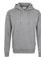
015 grau meliert