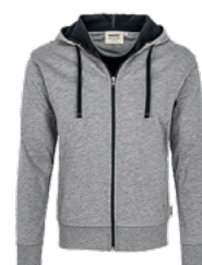
015 grau meliert/tinte