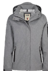
315 dunkelgrau meliert