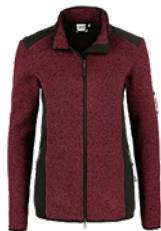
317 weinrot meliert

Ursprungsland Kambodscha Zolltarifnummer 6110 3091 Datenblatt Stand: 11/2023