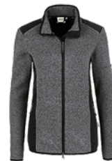
328 anthrazit meliert