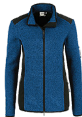
310 royalblau meliert