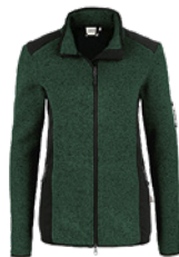
372 tanne meliert