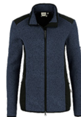
329 marine meliert