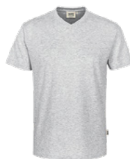
024 ash meliert