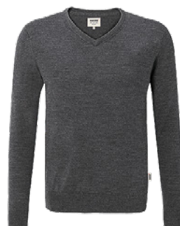
328 anthrazit meliert