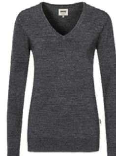
328 anthrazit meliert